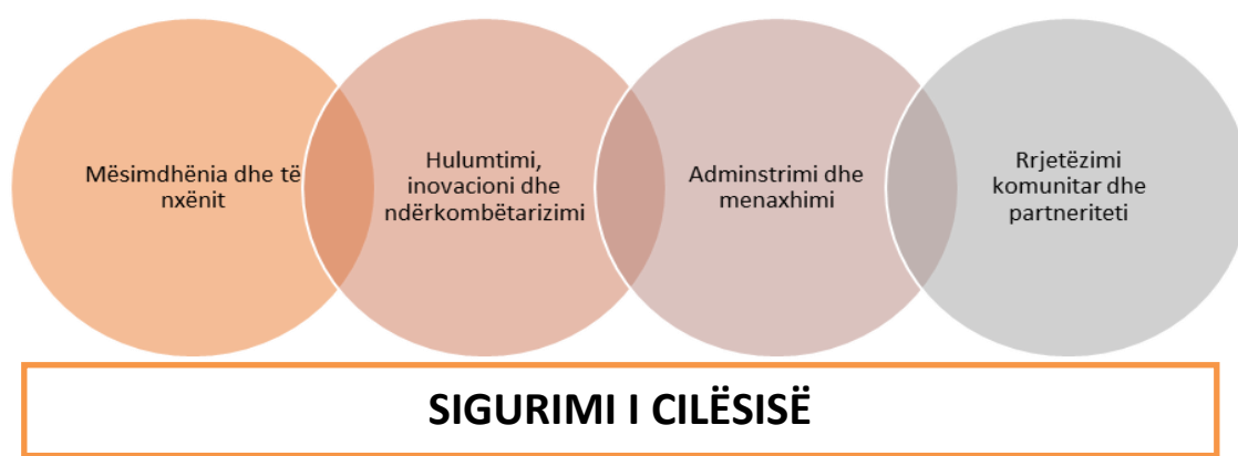
FIGURA 2. OBJEKTIVAT STRATEGJIKE TË FAKULTETIT TË EDUKIMIT

Fakulteti i Edukimit në procesin e planifikimit strategjik për periudhën pesë vjeçare 2022-2026 ka përcaktuar objektiven e përgjithshme strategjike dhe katër objektivat specifike, të cilat përveç që ndërlidhen ngushtë njëra me tjetrën, kanë për synim zhvillimin e një sistemi të qëndrueshëm të mekanizmave për sigurim të cilësisë me bazë në fakultet, në përputhje me mekanizmat qendrore të sigurimit të cilësisë në nivel universiteti dhe vendi.